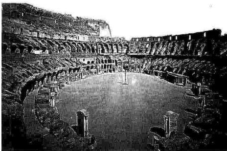
COM'ERA Interno del Colosseo, 1870 circa

I PRIMI STERRI NEL 1874 ATTUALMENTE C'È UNA PIATTAFORMA IN LEGNO PRESSO LO SPERONE STERN: DA QUI SI È AFFACCIATO OBAMA