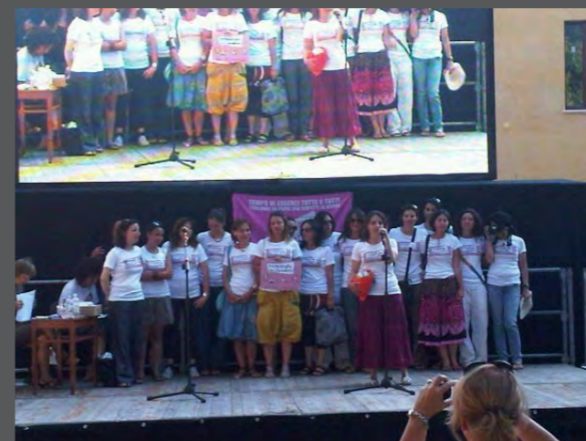
Attività di sensibilizzazione pubblica: evento nazionale SNOQ (Siena, 9-10 luglio 2011)

"Archeologhe che (r)esistono" si pone l'obiettivo di dar voce alle archeologhe, ai loro pensieri, bisogni e necessità lavorative mediante la raccolta di dati ed informazioni, sulla base di segnalazioni specifiche e censimenti mirati. I dati elaborati sono rilasciati per sensibilizzare l'opinione pubblica e far conoscere le realtà e le difficoltà di un lavoro che, seppur sempre più spesso declinato al femminile, comporta ancora molte zone d'ombra.