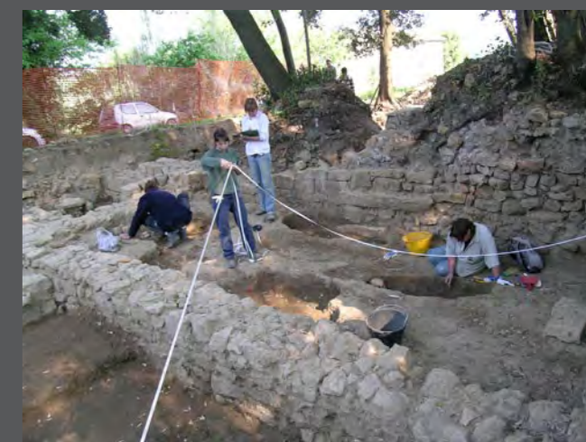
Archeologhe in cantiere

femminile italiana in archeologia. Il lessico utilizzato nel corso delle attività divulgative del gruppo è di fatto diventato di pubblico uso e ripreso anche in sedi istituzionali da esponenti politici e della società civile. Un interessante spunto da