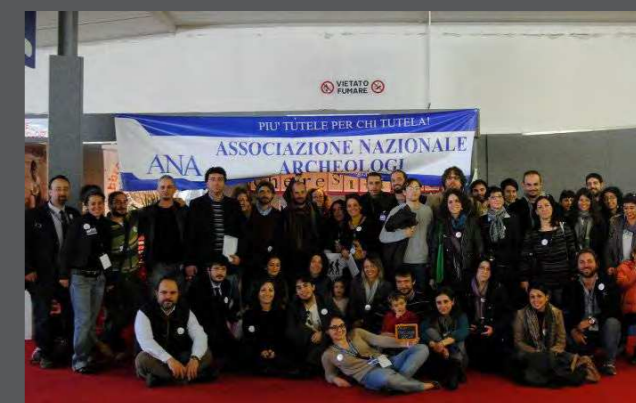
Alcuni partecipanti all'incontro annuale presso la Borsa del Turismo di Paestum (2011)

a lavorare ci ha dato la possibilità di capire la portata di un disagio, spesso tutto italiano, riguardante molti degli operatori nel settore dei Beni Culturali. Il quadro emergente dichiara che l'archeologia italiana è donna, freelance con alta formazione e competenze multidisciplinari, attiva in un impegno quotidiano di affermazione che rischia però concretamente di rimanere impigliata nella trappola della precarietà.